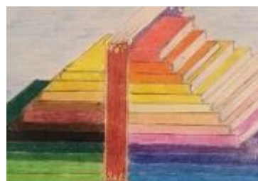
«A libri spiegati», a cura di Raffaele Cappellini

ad una vittima innocente delle mafie, ed una versione 2.0, leggibile anche su smartphone tramite un qr code che consente di scaricare materiale extra, come musica, video e altro. Insomma un modo semplice per ricordare e promuovere la legalità tra gli studenti, che aderendo all'iniziativa «L'ora legale» potranno scrivere, tramite il metodo della scrittura collettiva di Don Milani, e pubblicare Pizzini. Poi c'è l'iniziativa dei Libri sospesi: la tradizione partenopea del caffè sospeso, declinata in chiave libraria. È la possibilità di regalare un libro a chi non può permetterselo. Come? All'ingresso della Scugnizzeria i clienti